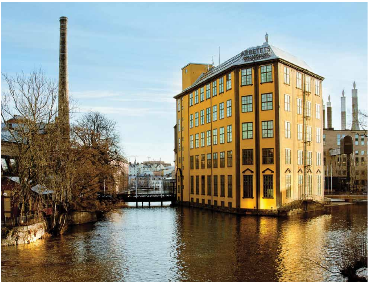
Berömd byggnad (Arbetets museum i Norrköping), Foto: Birgitta Sjöstedt/Mostphotos

Under året som gått har Kulturanalys reviderat och implementerat den kommunikationsstrategi som utarbetades 2011. Kulturanalys har i dag ett väl fungerande kommunikationsarbete. Vi har skapat nya kontakter inom kulturfältet och våra rapporter uppmärksammas av medier och andra aktörer. Kulturanalys har successivt vuxit fram som en relevant aktör inom det kulturpolitiska fältet. Målen för 2012 bedöms därmed som uppfyllda, även om publiceringen av vårt första cultural policy brief kommer att bli något förskjutet framåt i tiden.