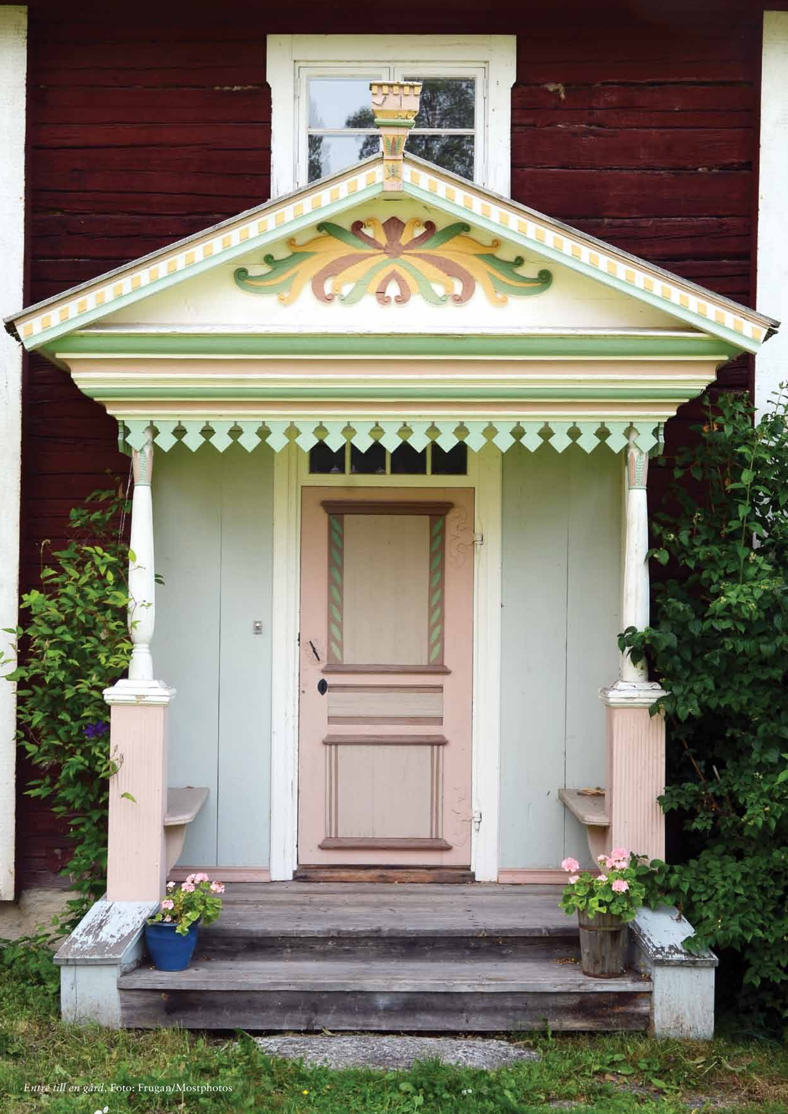
Entré till en gård