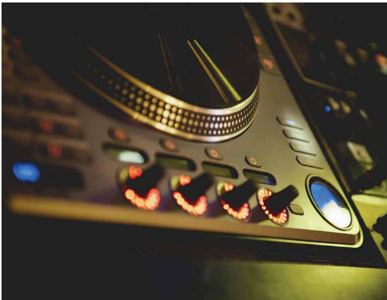
Dj-vändskiva i nattklubb, Foto: ifeelstock/Mostphotos

Målet är uppfyllt. Under 2013 bedömer vi att Kulturanalys kommer att ha mer resurser för att arbeta vidare med utveckling av utvärderingsmetoder. Genomförandet av ett utvärderingsseminarium kommer att vara ett led i detta arbete.