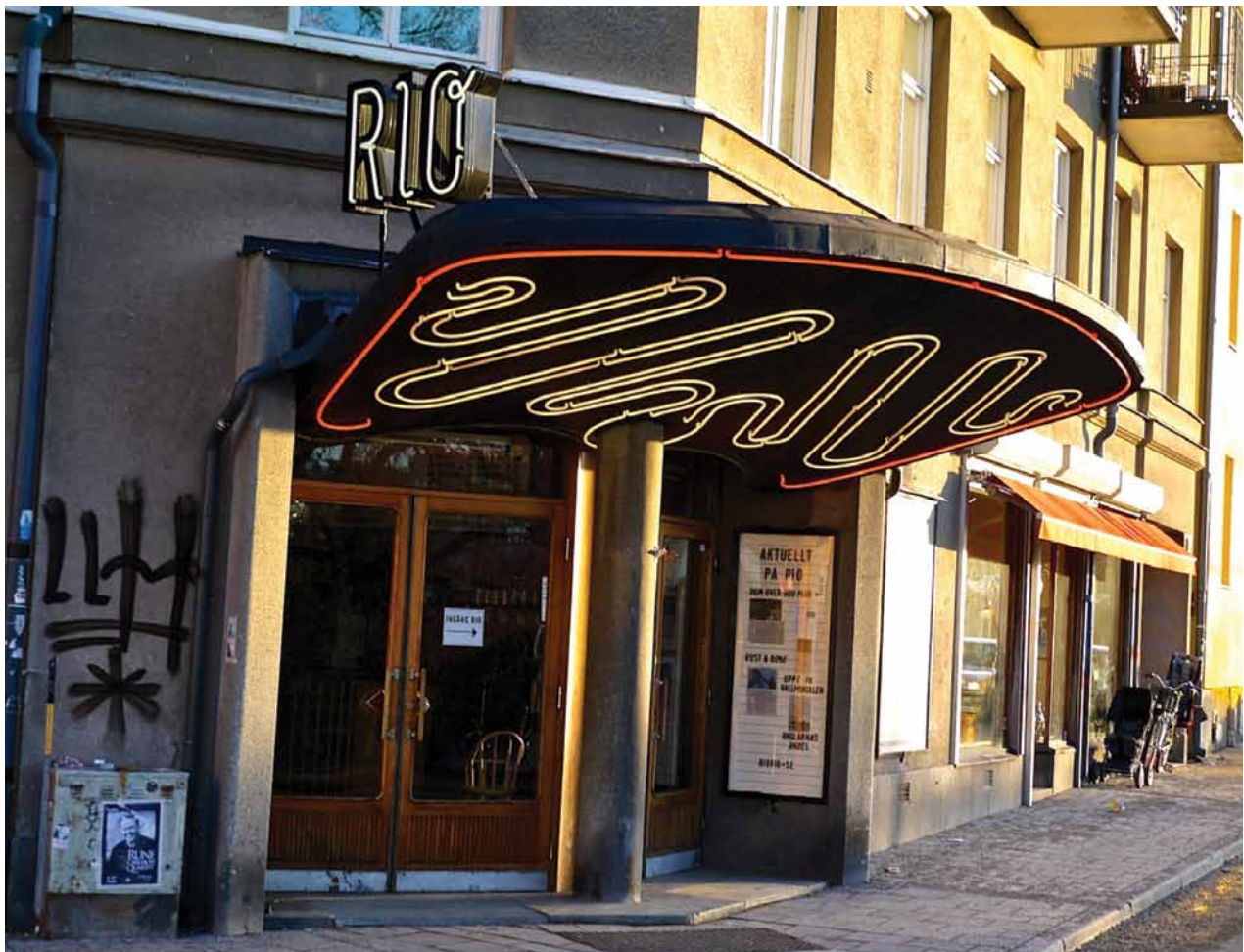
Bio Rio i Stockholm

Målen för 2012 är uppfyllda. Målen har i huvudsak syftat till att skapa förutsättningar för långsiktigt arbete med samhällsekonomiska analyser. Ett centralt led i detta arbete är att påbörja framtagandet av kunskapsunderlag till fortsatta analyser av kulturens samhällsekonomiska värde.