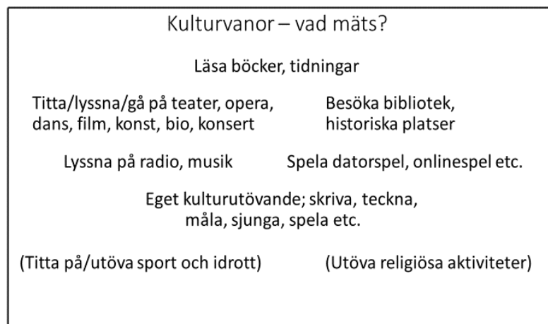
Figur 1. Sammanställning av vad kulturvaneformulären ställer frågor om.

Genomgången av de utförda undersökningarna har visat att kultur indirekt definierats på ett visst sätt. 32 Det kan vara värt att kort granska denna definition. Trots variationen som finns i formulären mäts i huvudsak samma fenomen. I figuren nedan sammanfattas det man frågat efter i de nordiska studierna.